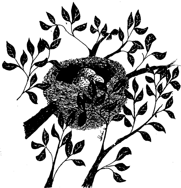
Nido de la Monterita Castaña ( Pospiza nigrorufa)