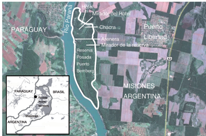
Figura 1. Ubicación y delimitación de la Posada y Reserva Puerto Bemberg en Misiones, Argentina, destacando sitios mencionados en el texto.