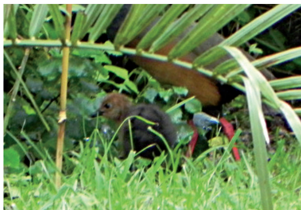
Figura 1. Polluelo de Chiricote ( Aramides cajanea) acompañado de un adulto (semitapado) en Mar de Cobo, Buenos Aires, Argentina, 11 de diciembre 2011.