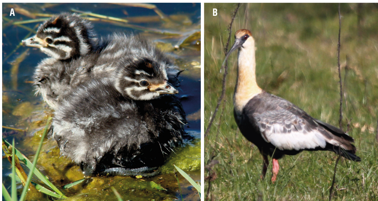
Figura 1. (A) Pichones de Macá Gris ( Tachybaptus dominicus) en el PCS, partido de Punta Indio, 21 de abril de 2012. (B) Bandurria Boreal ( Theristicus caudatus) en el PCS, partido de Punta Indio, 30 de abril de 2012.