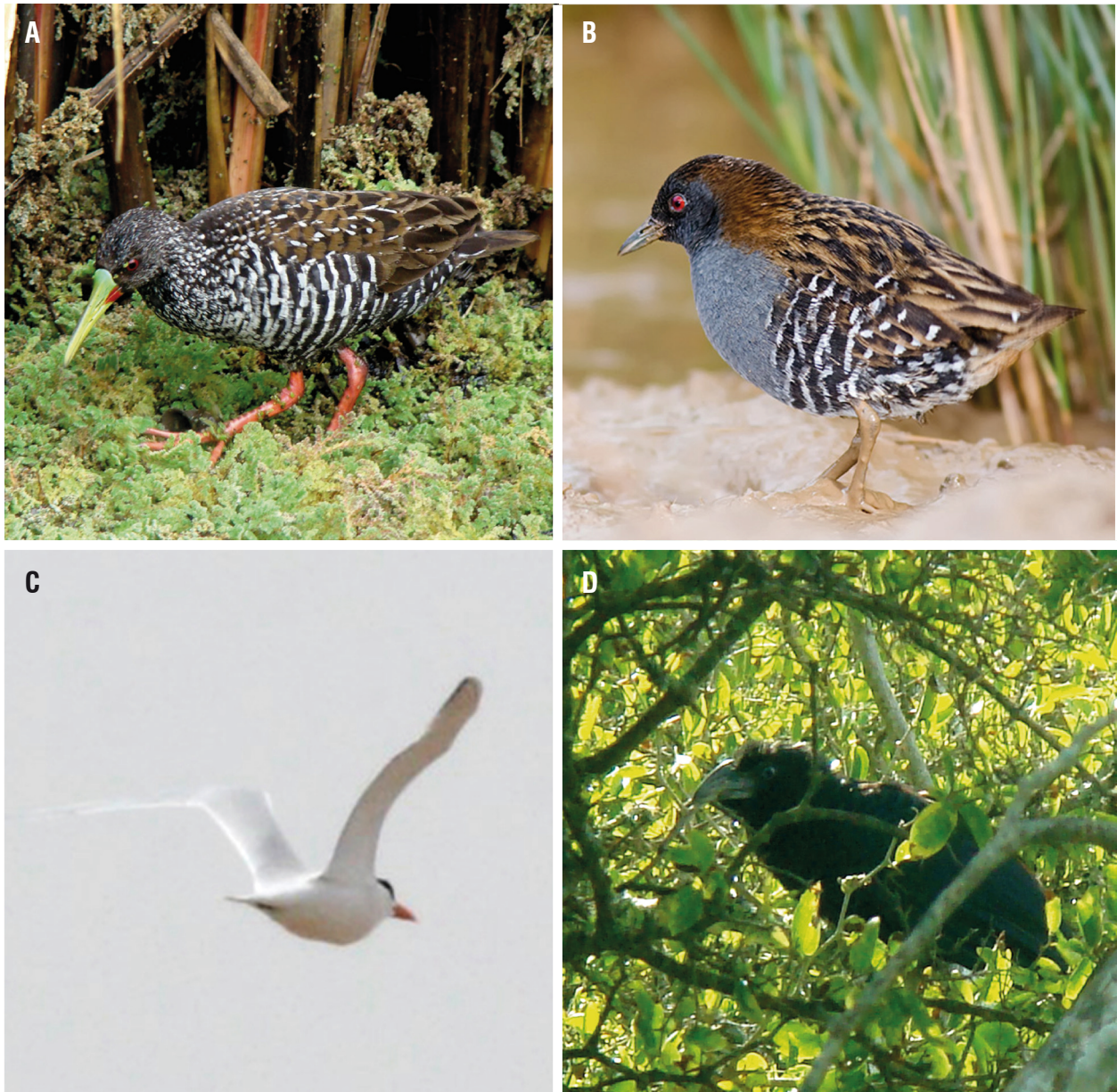
Figura 2. (A) Gallineta Overa ( Pardirallus maculatus ) en el PCS, partido de Punta Indio, 23 de octubre de 2010. (B) Burrito Negruzco ( Porzana spiloptera ) en el PCS, partido de Punta Indio, 7 de julio de 2013. (C) Gaviotín Real ( Thalasseus maximus ) en el balneario El Picaflor, Punta Indio, 9 de noviembre del 2013. (D) Joven de Anó Grande ( Crotophaga major ) en el PCS, partido de Punta Indio, 21 de abril de 2012.