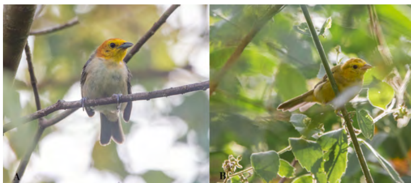
Figura 2: Saí-canário ( Thlypopsis sordida ) A) macho y B) fêmea registrado no dia 25 de janeiro de 2023 na Ilha Comprida em Porto Lucena, estado do Rio Grande do Sul, Brasil.