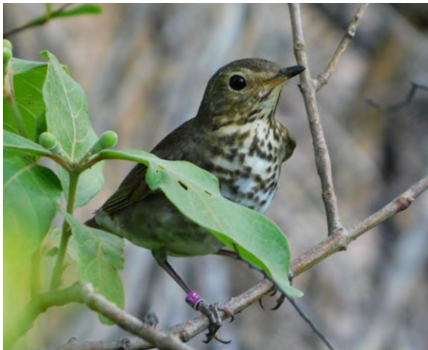
Figura 1: Fotografía del Zorzalito Boreal ( Catharus ustulatus ) capturado en la Reserva Natural Rincón de Santa María, Ituzaingó, Corrientes, Argentina, el 22 de noviembre de 2022 a las 17:50 h. Imagen tomada luego de capturar, identificar y liberar el ave.

regularmente el oeste de Sudamérica, desde Colombia, Ecuador y Venezuela hasta el noroeste de Argentina (Mack & Yong 2020). El área de distribución del Zorzalito Boreal en Argentina comprende mayormente las provincias de Jujuy, Salta, Tucumán, Catamarca y Córdoba. Durante la primavera y verano austral, es considerada un ave común en la región de las Yungas (Capllonch 2012; De la Peña 2020). Sin embargo, en los últimos años los registros aislados de Zorzalito Boreal en diferentes provincias se han incrementado, contando actualmente con registros en Entre Ríos (Parera 1990; Dardanelli 2018), San Juan (Lucero & Chebez 2011), Santiago del Estero (Capllonch 2012; Quiroga et al. 2016; Coria et al. 2021), Santa Fe (Yn-