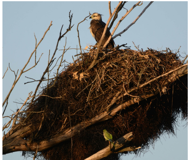
Figura 3: Volantón de Águila Coronada o Águila del Chaco ( Buteogallus coronatus ) posado sobre el nido, el cual está construido encima de un nido activo de Cotorra Argentina ( Myiopsitta monachus ) en un Eucalipto ( Eucalyptus sp.). Individuo observado el 18 de enero de 2020 cerca de Colonia Clara, Santa Fe, Argentina.

El área se encuentra dentro de la ecorregión del Espinal (Fig. 2), y es un mosaico de establecimientos ganaderos (para la cría/invernada de bovinos), campos agrícolas (para el cultivo de especies como soja, sorgo y maíz) y parches de bosque nativo con ejemplares de Algarrobo ( Ceratonia siliqua ), Quebracho Blanco ( Aspidosperma quebracho-blanco ), Chañar ( Geoffroea decorticans ) y Espinillo ( Acacia caven ). La precipitación anual varía entre 917 y 1165 mm, y las temperaturas medias anuales se encuentran en el rango de 11 y 25 °C (Cabrera 1976).