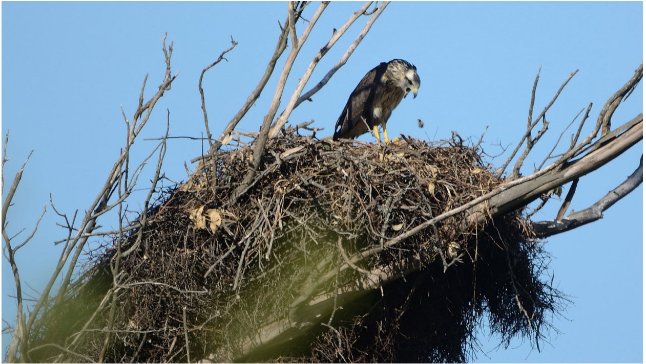
Figura 5: Volantón de Águila Coronada o Águila del Chaco ( Buteogallus coronatus ) eliminando una egagrópila en el nido. Individuo observado el 18 de enero de 2020 cerca de Colonia Clara, Santa Fe, Argentina.