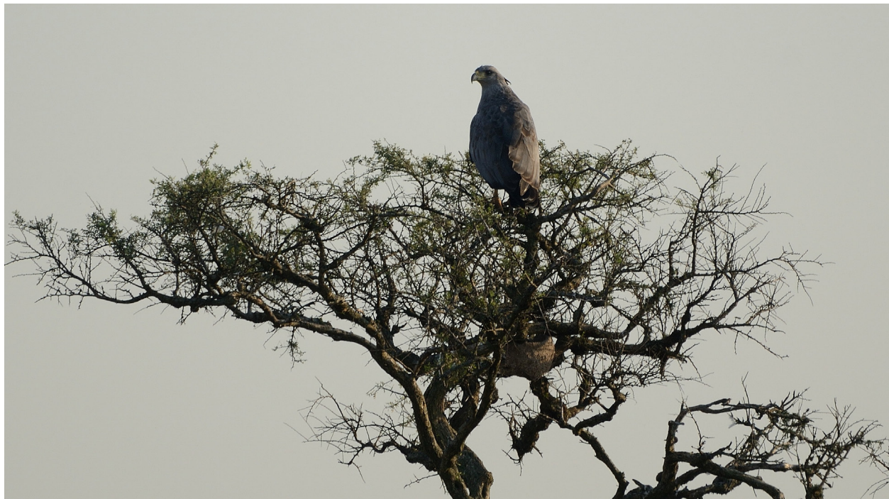
Figura 4: Adulto de Águila Coronada o Águila del Chaco ( Buteogallus coronatus ) posado sobre un árbol cercano al nido. Individuo observado el 18 de enero de 2020 cerca de Colonia Clara, Santa Fe, Argentina.

Mientras VM estaba fotografiando al volantón de Águila Coronada, un adulto pasó cerca del nido, se posó en un árbol a unos 100 metros y empezó a emitir vocalizaciones (Fig. 4). Acto seguido, el volantón eliminó 2 egagrópilas (Fig. 5) y voló para encontrarse con el adulto. Tres días después, VM volvió a visitar el nido, confirmando que el