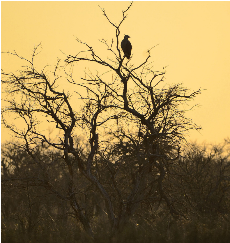
Figura 6: Juvenil de Águila Coronada o Águila del Chaco ( Buteogallus coronatus ) posado en un árbol cerca del nido. El individuo fue observado el 14 de julio de 2020 cerca de Colonia Clara, Santa Fe, Argentina.

volantón seguía en el nido. Las lluvias posteriores impidieron más visitas, pero el volantón ha sido visto en repetidas ocasiones durante el invierno (Fig. 6).