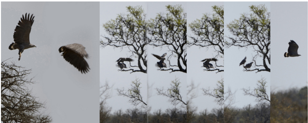
Figura 1: Cópula entre dos adultos de Águila Coronada o Águila del Chaco ( Buteogallus coronatus ) observados el 20 de septiembre de 2019 en las cercanías de Colonia Clara, Santa Fe, Argentina.

El 20 de septiembre de 2019, VM registró una cópula entre dos adultos de Águila Coronada (Fig. 1) cerca de Colonia Clara, Santa Fe, Argentina. El 18 de enero de 2020, a unos 10 km de dicho lugar (Fig. 2; 30°32'S, 61°06'O), VM encontró un nido activo de Águila Coronada (Fig. 3) en un Eucalipto ( Eucalyptus sp.) seco, a unos 12 m del suelo.