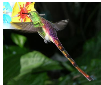
Estas tres imágenes ilustran el ejemplar que se acercó a los libadores en junio de 2007.

además La Pampa (Chebez et al. , 1998). En Santa Fe fue observado en Villa Gobernador Gálvez por M. Manassero y H. Luna. Raro, se desconoce su residencia y nidificación local (De la Peña, 2006, Manassero et al. , 2006).