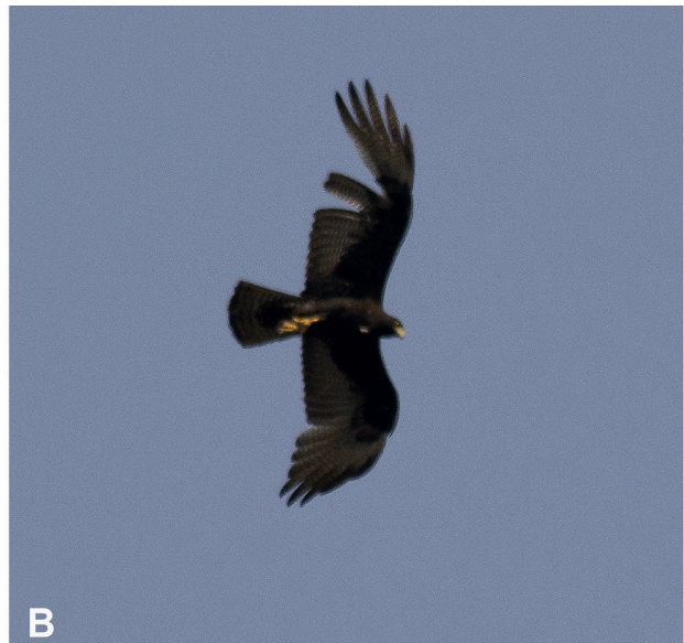
Figura 2: Aguilucho Negro o Aguilucho Jote ( Buteo albonotatus ) observado el 22 de agosto de 2021 sobrevolando la reserva Urbana del arroyo Itá, Posadas, departamento capital, Misiones, Argentina.

se perdió de vista rumbo sureste-este. El mismo individuo de Aguilucho Negro permaneció aproximadamente 98 días en la zona, donde fue avistado posteriormente, además de los autores, por otros observadores (Collado 2021; Díaz 2021; Pajareritos Argentinos 2021; Sosa 2021; Spajic 2021). Si bien el animal no estaba anillado, determinamos que se trataba del mismo individuo por la postura particular de la pata derecha (debido, probablemente, a una malformación o lesión). La ciudad de Posadas, se encuentra en el sur de la provincia de Misiones, emplazada en el Distrito de los Campos. Este Distrito representa un ambiente de transición gradual entre las provincias biogeográficas Paranaense y Chaqueña (Cabrera 1976), representando el límite de distribución para muchas formas tanto selváticas como Chaqueñas y Pampeanas (Giraudó & Povedano 2004). Este trabajo es relevante dado que damos a conocer el primer registro documentado de Aguilucho Negro para la provincia de Misiones, donde se la considera una especie muy rara según Pearman & Areta (2020).