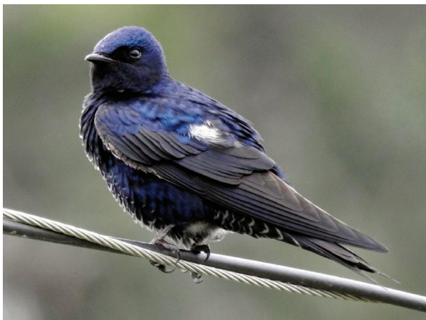
Figura 1: Golondrina Negra ( Progne elegans ) fotografiada el 5 de octubre de 2019 en Fazenda Cerro dos Porongos, municipio de Alegrete, Rio Grande do Sul, Brasil.

BENCKE A. (2019). eBird Checklist: https://ebird.org/ebird/view/checklist/S60480009 . eBird: An online database of bird distribution and abundance [web application]. eBird, Ithaca, New York. Available: http://www.ebird.org . (05/12/2019).