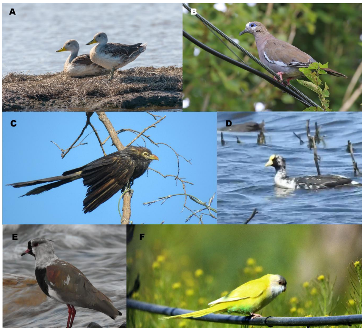
Figura 1. Aves con aberraciones cromáticas registradas en Argentina: (A) Patos Maiceros con dilución, 2 de febrero de 2025. (B) Torcaza Ala Blanca con leucismo parcial, 28 de febrero de 2025. (C) Pirincho con eumelanismo, 19 de octubre de 2024. (D) Gallareta Chica con depigmentación progresiva, 30 de octubre de 2024. (E) Tero con depigmentación progresiva, 7 de septiembre de 2023. (F) Catita Serrana Grande con xantocroismo, 15 de agosto de 2024.

ba el plumaje de la cabeza y el cuello oscurecido, con plumas negras distribuidas en corona y nuca (Fig. 2C). GG detectó otro ejemplar de Hornero pero con leucismo parcial el 18 de junio de 2022, a las 17:08h, en Firmat (33°27'S, 61°29'O), Departamento de General López, Santa Fe, forrajeando en el suelo. Presentaba plumas blancas en la región dorso escapular, los flancos y la cabeza, de distribución simétrica bilateral. Los ojos, el pico y las patas presentaban la coloración habitual de la especie (Fig. 2D).