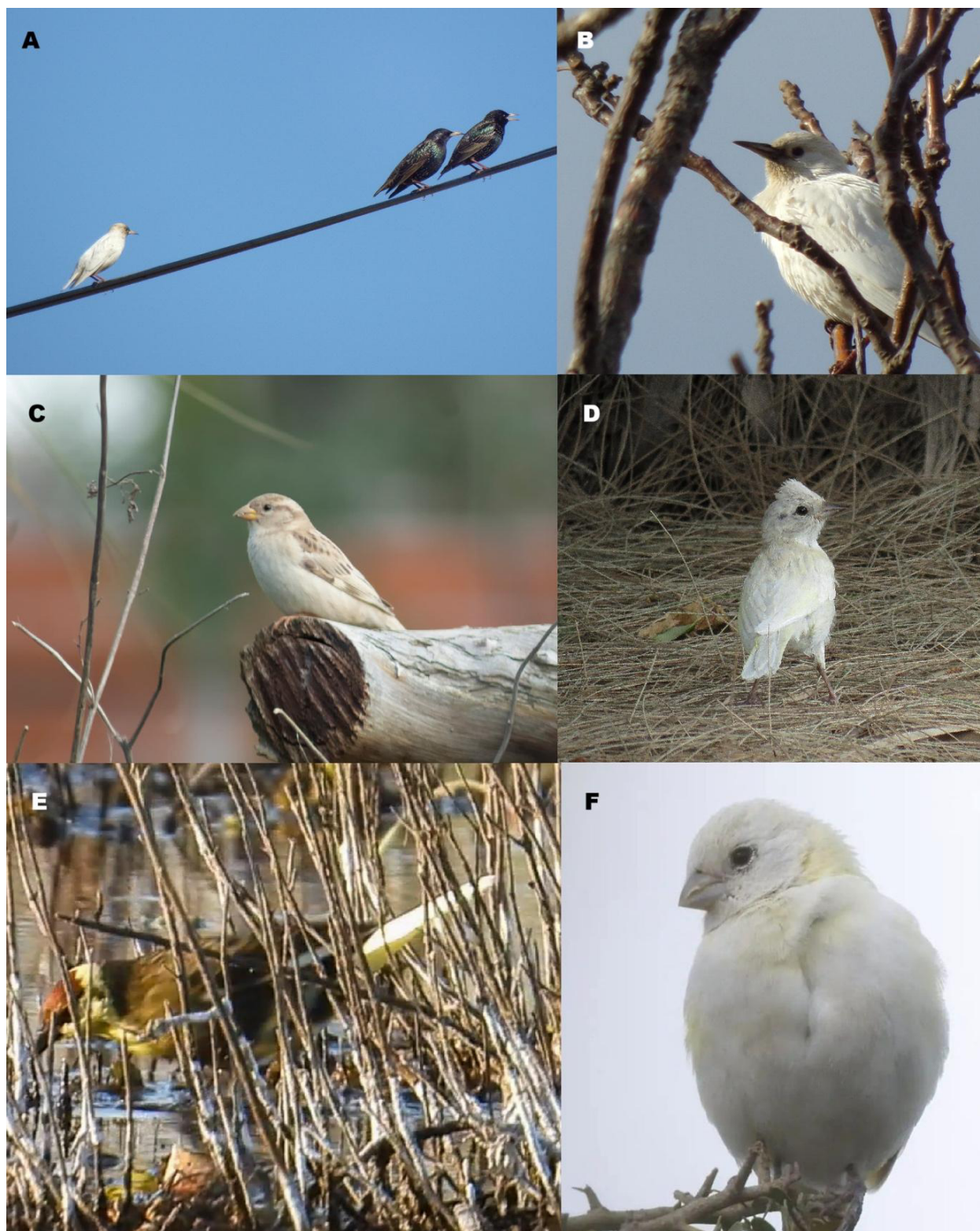
Figura 3. Aves con aberraciones cromáticas registradas en Argentina: (A) Estornino Pinto con leucismo, 11 de septiembre de 2024. (B) Estornino Pinto con leucismo, 5 de junio de 2025. (C) Gorrión con leucismo, 7 de agosto de 2025. (D) Chingolo con leucismo, 13 de marzo de 2021. (E) Varillero Congo con xantocroismo, 10 de agosto de 2025. (F) Jilguero Dorado con leucismo, 19 de junio de 2023.