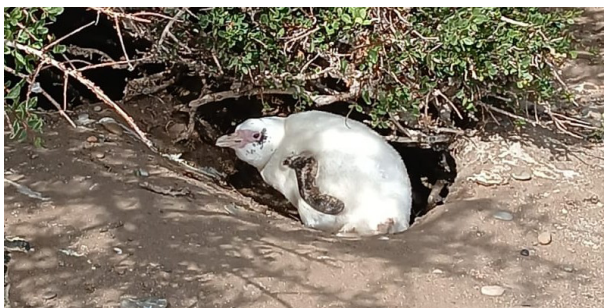
Figura 3. Pingüino Patagónico con leucismo parcial observado en Punta Entrada, presentando casi la totalidad del plumaje blanco.

Si bien estas condiciones del plumaje son poco