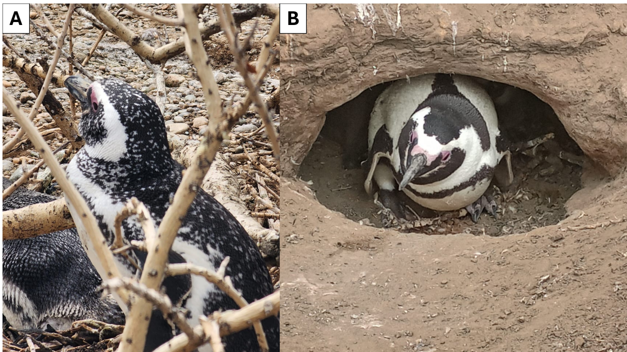
Figura 2. Pingüinos patagónicos con aberraciones cromáticas (leucismo parcial) registrados en el Parque Nacional Monte León. (A) Individuo con pequeñas manchas blancas distribuidas en todo su plumaje. (B) Ejemplar con grandes parches blancos a ambos lados del lomo.