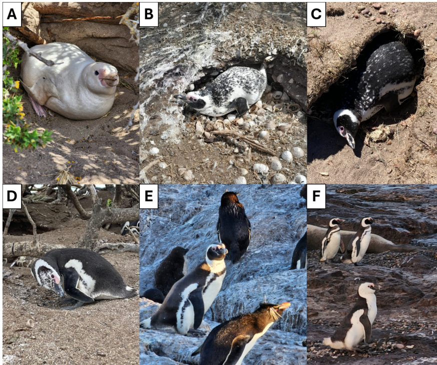
Figura 1. Pingüinos patagónicos con aberraciones cromáticas registrados en el sector noreste de Santa Cruz, observándose casos de leucismo total (A) y parcial (B-F). (B y C) Individuos con manchas blancas distribuidas sobre el lomo. (D) Ejemplar con coloración atípica en el rostro. (E) Individuo con la banda superior del pecho ausente; se observan también ejemplares de Pingüino Penacho Amarillo ( Eudyptes chrysocome ). (F) Ejemplar con el rostro blanco y sin las bandas del pecho; detrás se observan ejemplares de la misma especie con la coloración típica.