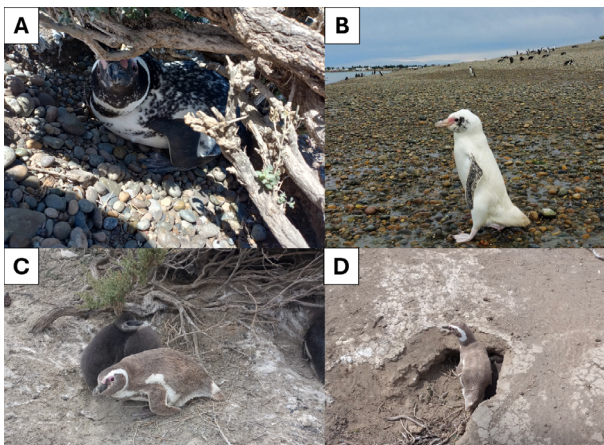
Figura 4. Pingüinos patagónicos con aberraciones cromáticas registrados en Isla Cormorán, observándose casos de leucismo parcial (A y B) y de mutación marrón (C y D).